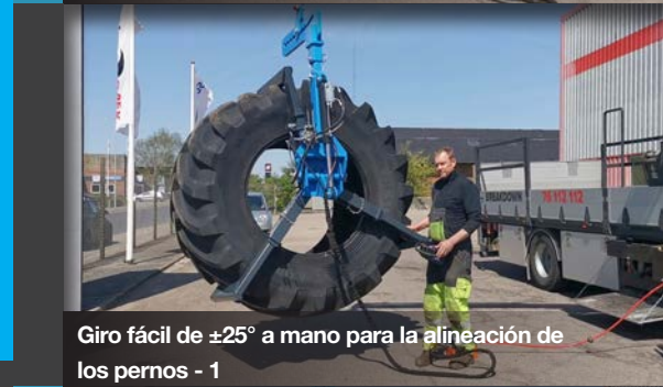
Giro fácil de \pm 25^\circ a mano para la alineación de los pernos - 1