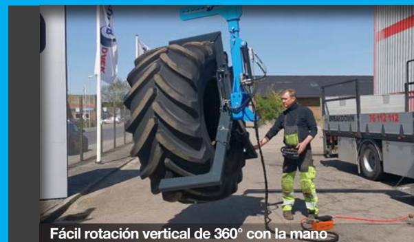
Fácil rotación vertical de 360° con la mano