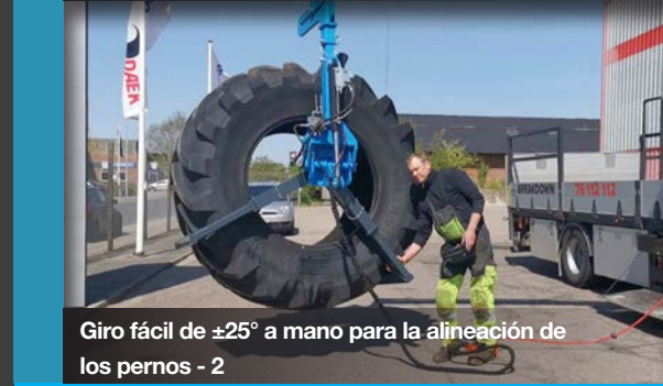
Giro fácil de \pm 25^\circ a mano para la alineación de los pernos - 2