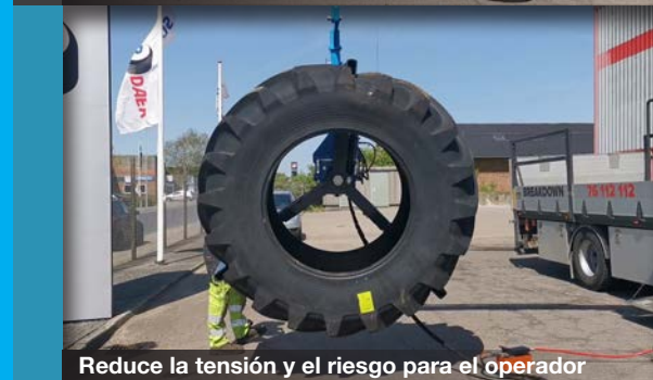
Reduce la tensión y el riesgo para el operador