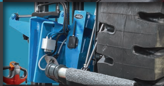
Los tubos con revestimiento de piedra garantizan un agarre seguro