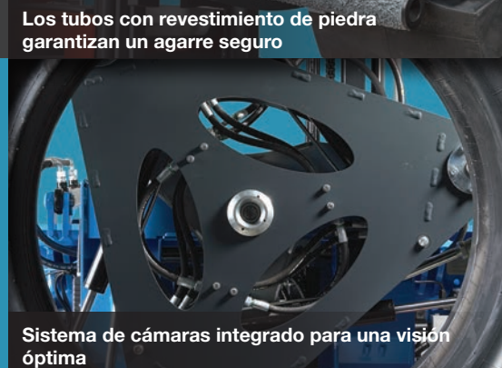
Sistema de cámaras integrado para una visión óptima