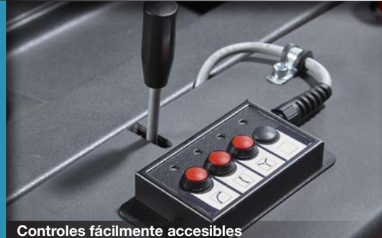
Controles fácilmente accesibles