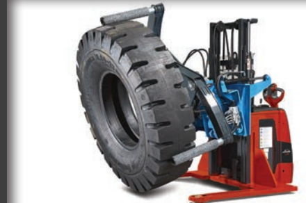
Inclinación precisa de \pm 15^\circ .