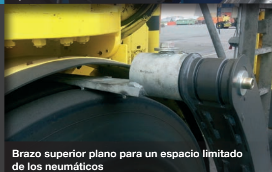
Brazo superior plano para un espacio limitado de los neumáticos